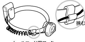
カールコード用フック

LEDライト、電池ボックスのクリップでベルトを挟んで使用します。ヘッドライトにしたり、腕などに巻き付けて使用できます。