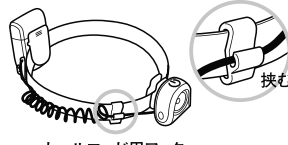
カールコード用フック

LEDライト、電池ボックスのクリップでベルトを挟んで使用します。ヘッドライトにしたり、腕などに巻き付けて使用できます。