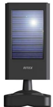
ソーラーパネル コード長さ:約5m