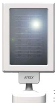
ソーラーパネル コード長さ:約5m