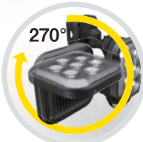
左右ライト (2灯・3灯タイプのみ)