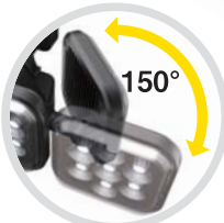
左右ライト (2灯・3灯タイプのみ)